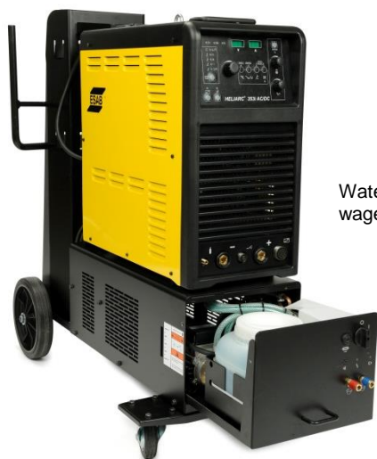
Waterkoeler past in wagencompartiment